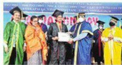
విద్యార్థులకు పట్టాలను అందజేస్తున్న దృశ్యం