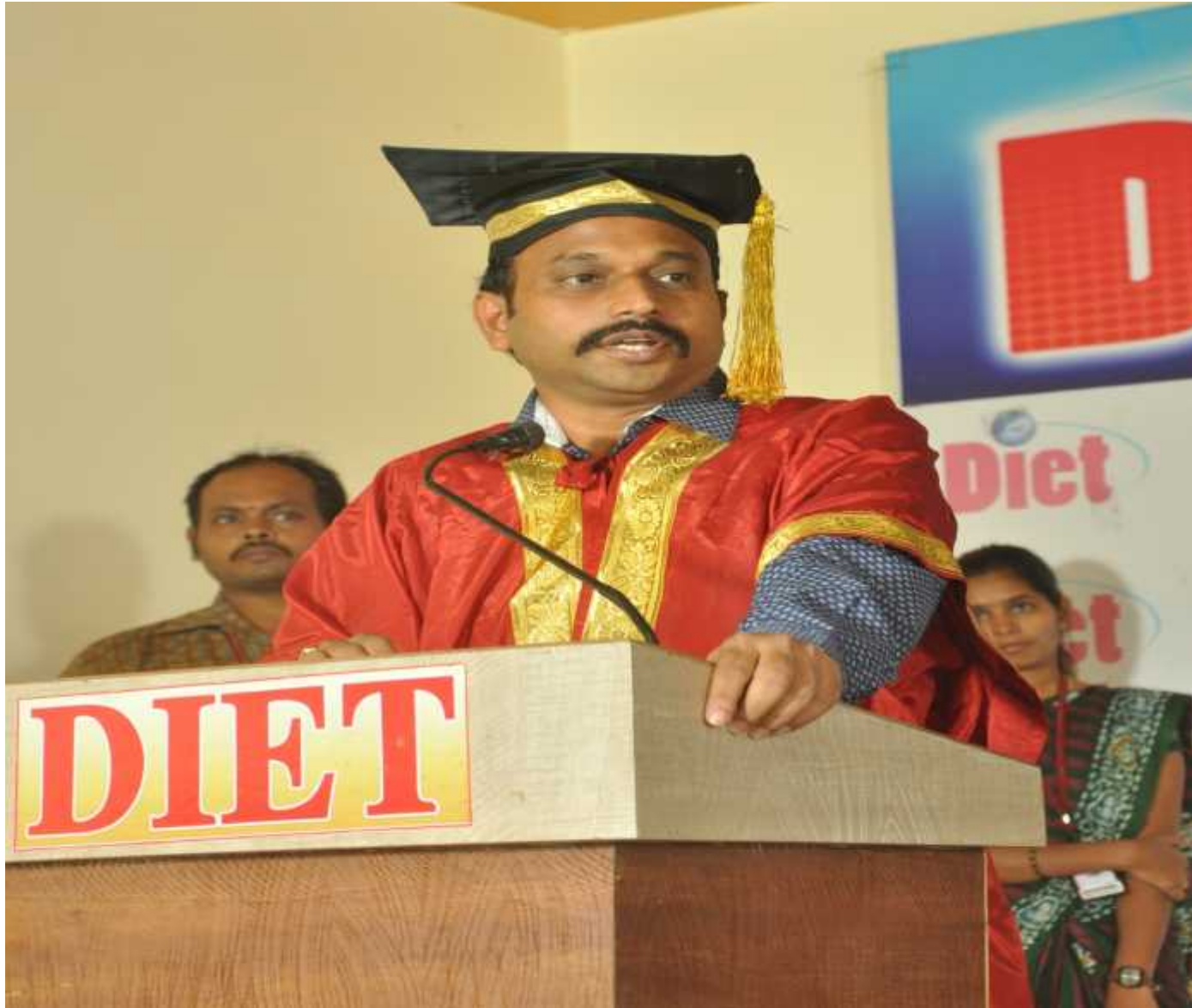
Hon'ble Correspondent addressing the gathering