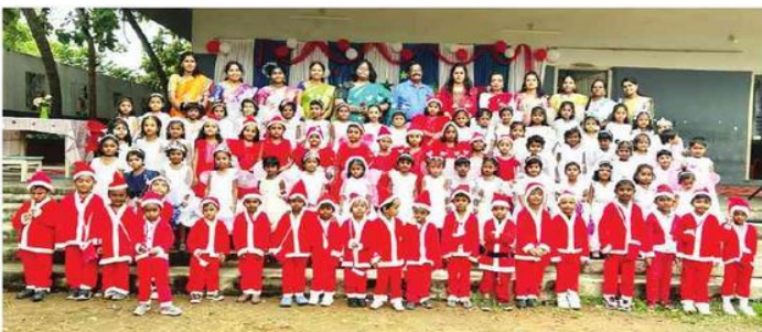
పరవాడ ఎబిఎస్ పబ్లిక్ స్కూల్లో జరిగిన క్రిస్మస్ వేడుకలు