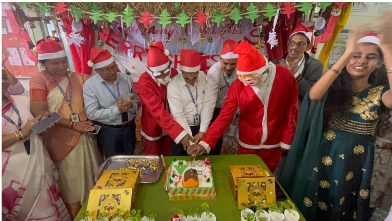
Enjoying the event with dances