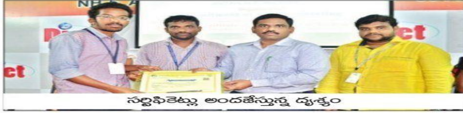
సర్టిఫికేట్లు అందజేస్తున్న దృశ్యం

డైట్ లో రివిట్ స్ట్రక్చర్ (సివిల్) పై ఘనంగా ముగిసిన ఆరురోజుల వర్క్ షాపు