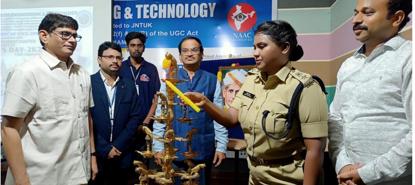
Chief Guest Lightening the lamp to mark the granulation