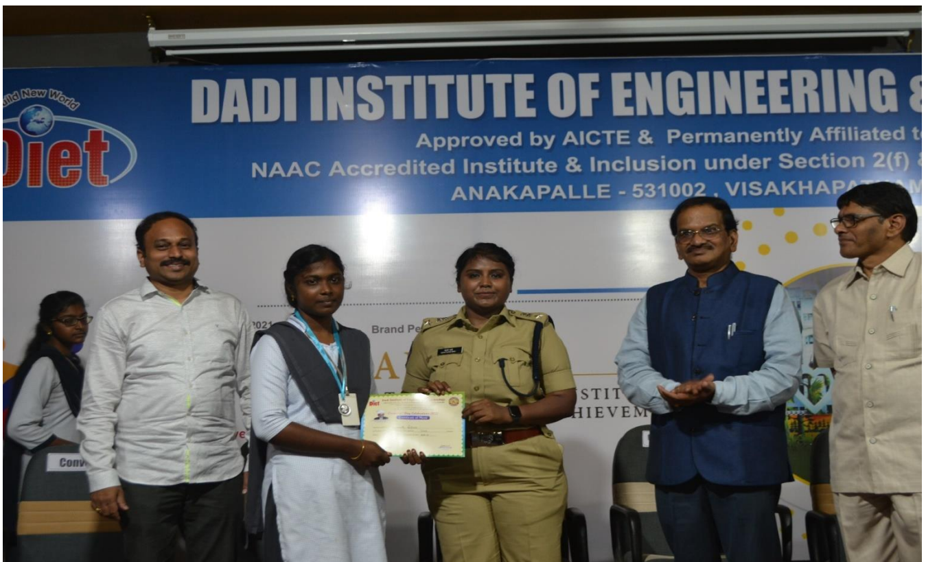
Academic toppers of the semesters of all branches were given 20 grams pure Silver Medal