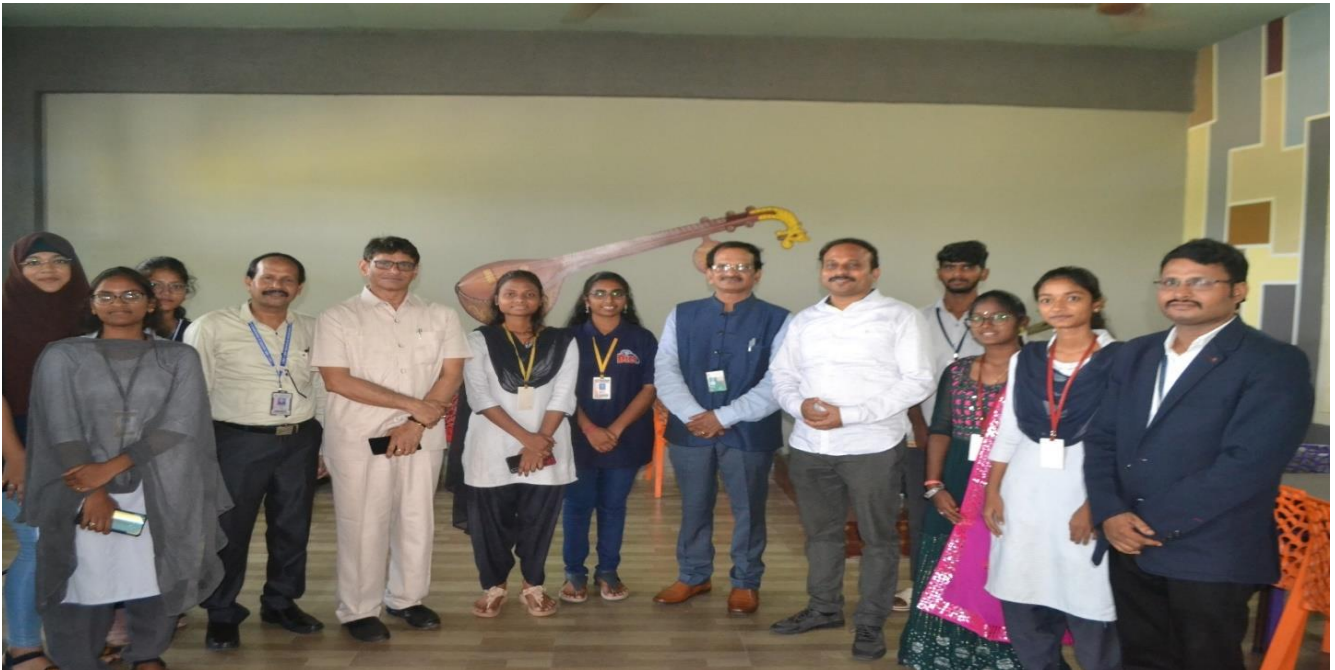
Visit of Guest of Honor to Student Activity Centre