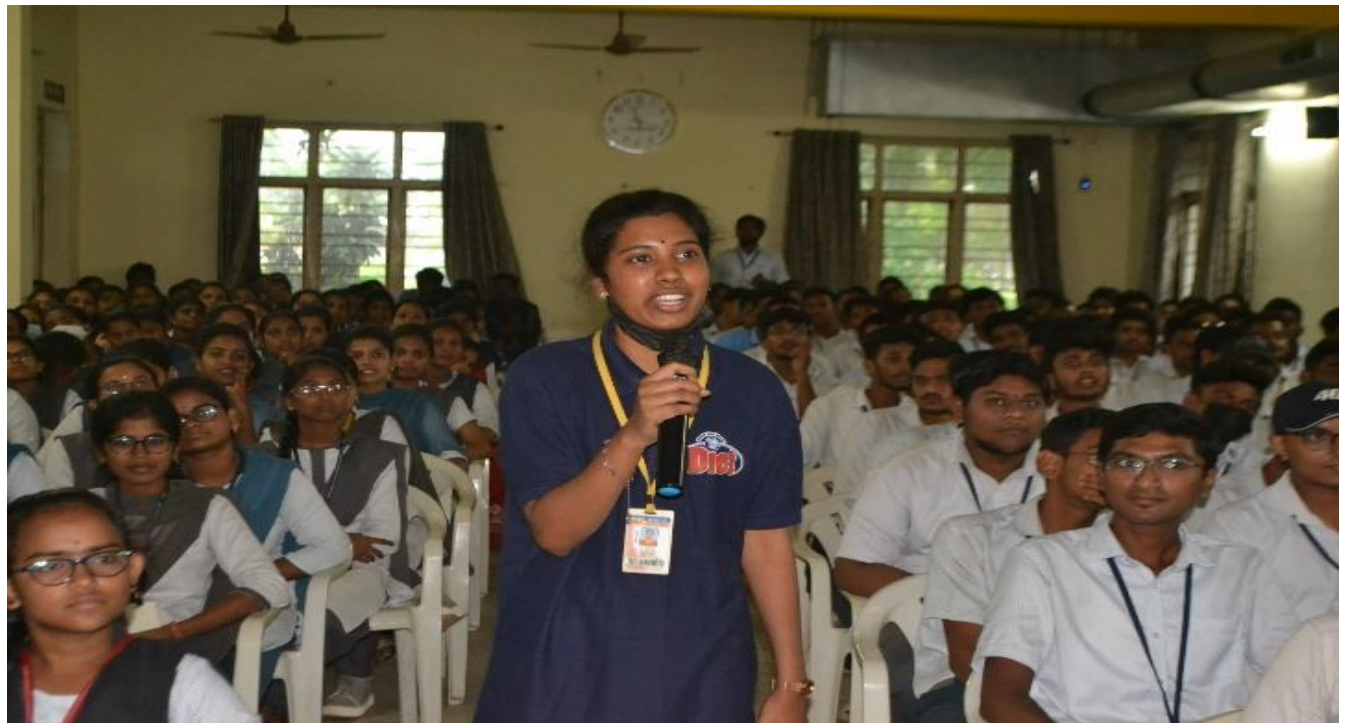
Students interacting with the Chief Guest