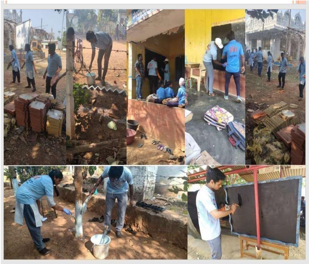
NSS Unit student volunteers visited Maredupudi village on 9-1-2023