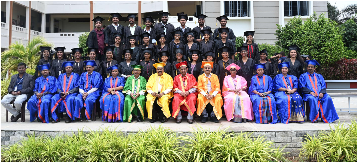
2019-2023 Batch - ECE Department