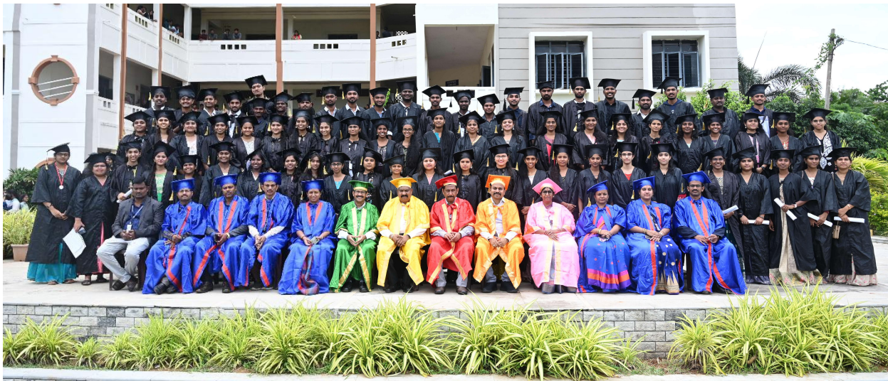
2019-2023 Batch - CSE Department