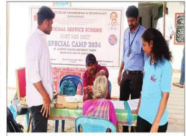
నేత్ర పరీక్షలు చేస్తున్న వైద్యులు