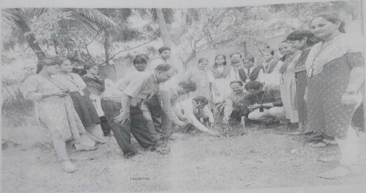
Plantation by principal sir & Vice principal sir