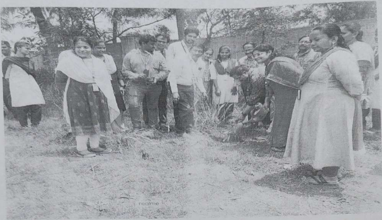
Vice-Principal sir planting the trees in college premises