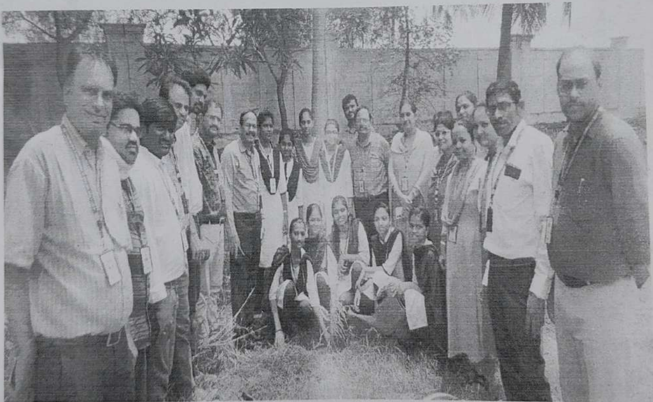
Students planted the trees