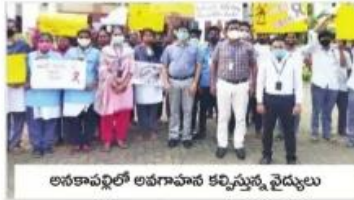
అసకాపర్లలో అవగాహన కల్పిస్తున్న వైద్యులు